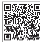
当協会の ホームページ

2025年5月に、福岡県でスヌーズレンの国際的な団体が誕生しました。これまで九州に拠点を置くスヌーズレンの協会や研究会はありませんでした。私たちのこの団体が九州におけるスヌーズレン活動の先駆者的な役割を担います。ここ九州から日本全国及び世界に向けてスヌーズレンの情報発信を行って、スヌーズレンの専門性をもつ人々を少しずつ養成していきます。