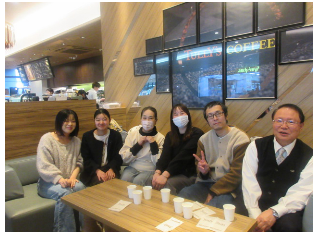
研修会後の茶話会で皆で談笑する